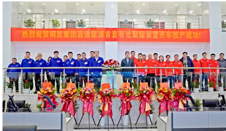
热烈祝贺桐昆集团嘉通能源首套有光聚酯装置开车投产成功