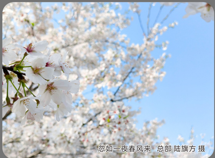
忽如一夜春风来 总部 陆旗方 摄