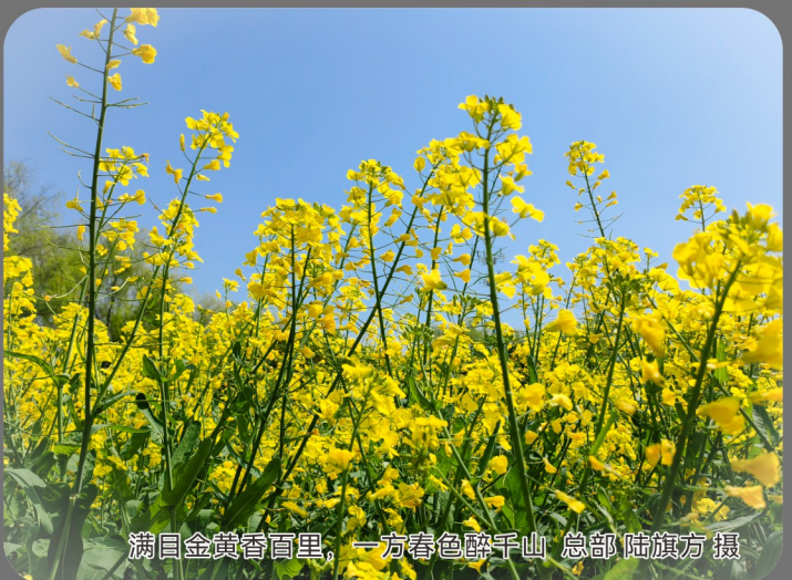
碧金盈翠留碧里，一帘春色醉千山 总部 陆旗方 摄