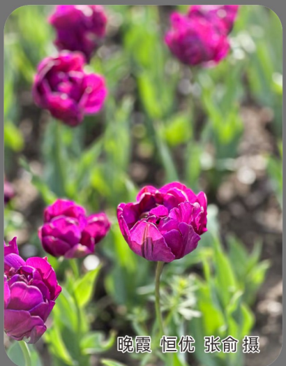
晓霞 恒晓 张命棋