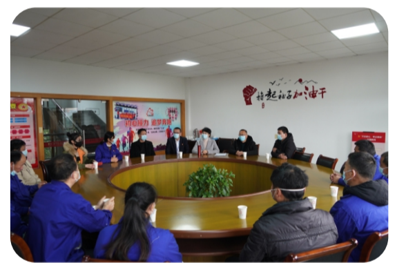
此类慰问活动，以真情和实际行动温暖了困难家

庭及困难职工的心，未来，集团将一如既往做好困难群体的帮扶工作，向他们传递桐昆温度，为建设和谐社会助力。