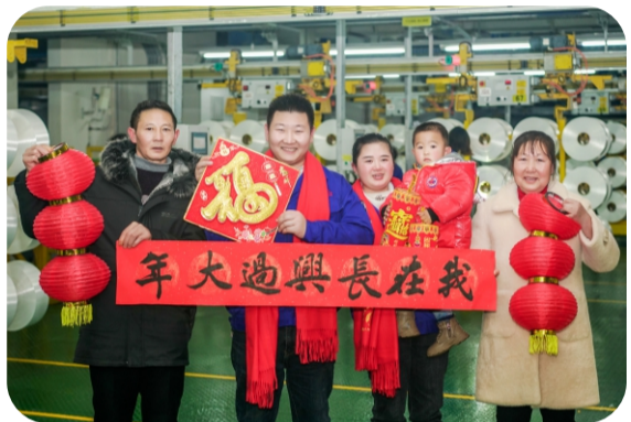
别样团圆赢人心 家属大互动

为了疫情防控大势，为了守住更多人的平安幸福，有这样一群人选择和家人一起留下就地过年。集团没有忘记他们的付出，及时送来了关心与关爱。