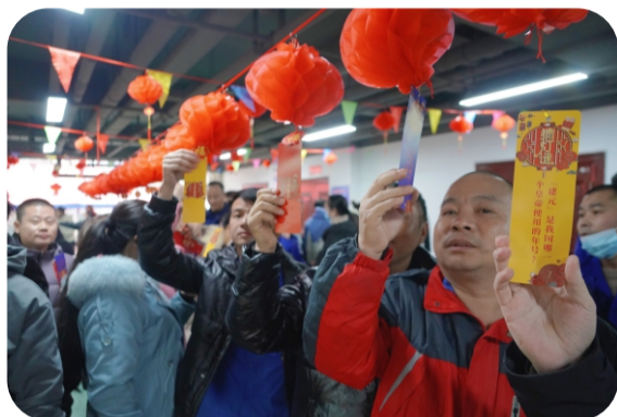
吃喝玩乐年味足 新春游园会

1月28日上午，天空微落小雨裹挟着阵阵寒意，而集团洲泉生活区内却是一片挡不住的热热闹闹，一场新春游园会在这里上演，给就地过年的桐昆人带来融融暖意。