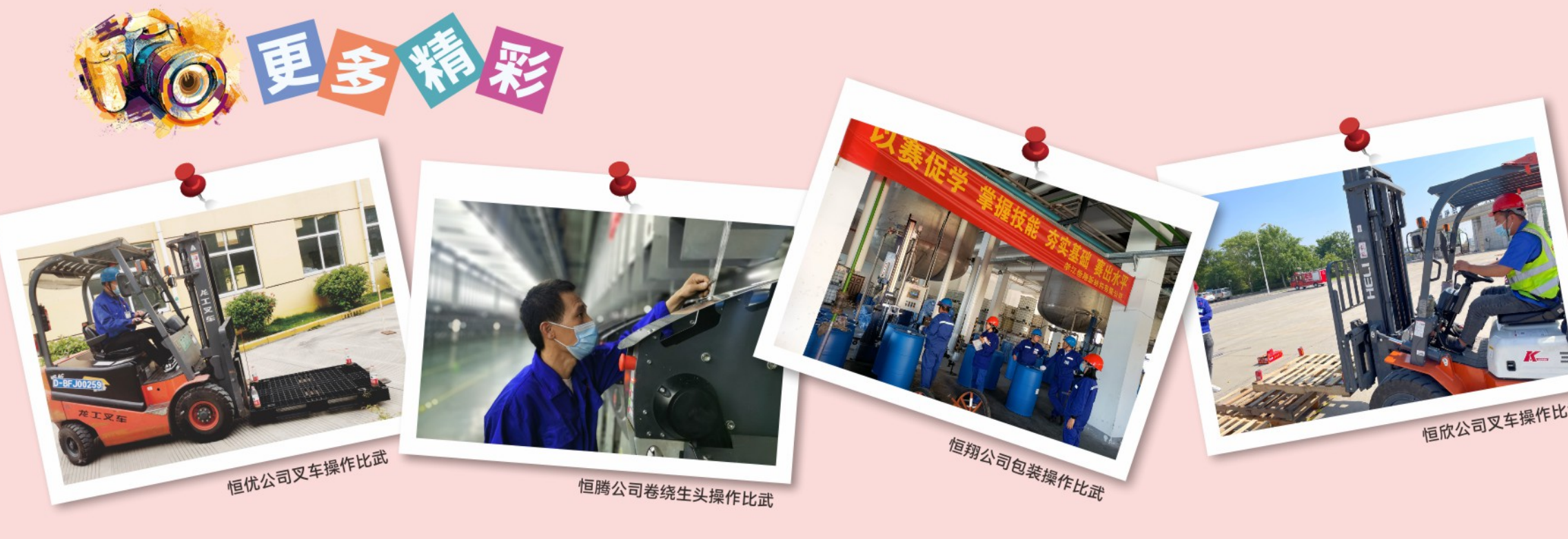
恒优公司叉车操作比武