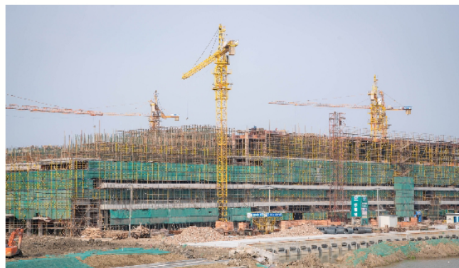
建设时的恒超工地

她说：今年，是我在桐昆的第五年，我对工作依旧全力以赴，明年、明年的明年，我希望自己能够一直保持着当初进公司时对工作的这份热忱、这份初心。