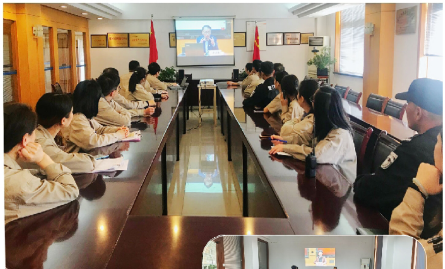
11月7日上午,2020年第四期南湖初心讲堂——“红船党课”在线上开讲,集团各支部纷纷组织党员观看。