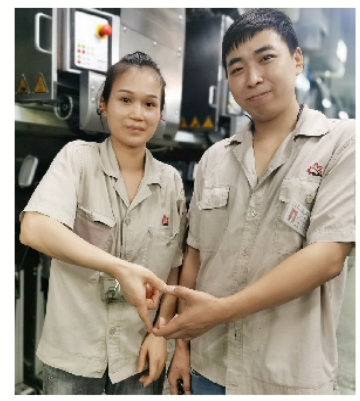
我们在车间

其实2014年的时候，我们就来过桐昆，后来家里有事就离职了，事情办好想着换个环境就去了嘉兴，期间零零碎碎也换过许多工作，但兜兜转转觉得还是大企业稳定，待遇好，2018年我俩又再次进入了恒通公司。疫情期间的经历，让我们更加觉得，桐昆是我们可以依靠的、可以干一辈子的地方。