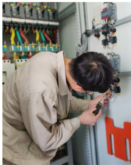
我在检修

我想，电工嘛，总归到哪里都是可以找到工作的，哪有像桐昆管的这么严的。后来在一个小厂里面上班，虽然在那里我被安排在了常日班，但因为工厂小，管理又很乱，电工也就我一个，所以反而更加忙碌了，一停不停的，什么都要我来