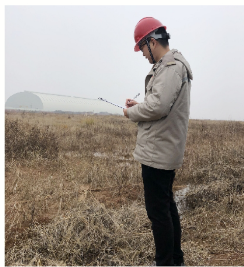
我在工地

2020，桐昆在发展；我，在成长，这将是职场生涯的一个新起点，我将在这里重新起航，向着梦想，努力奋斗！