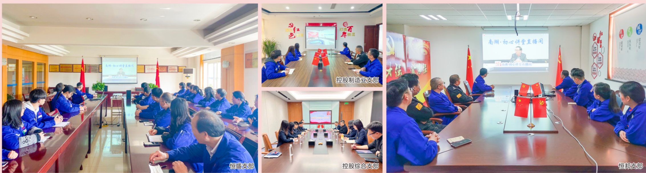
3月15日,桐昆集团党委组织各支部收看红船党课,聆听浙江红船干部学院副院长、中共嘉兴市委党校副校长徐连生主讲《增强信心底气 汇聚发展合力——2024全国两会精神解读》。