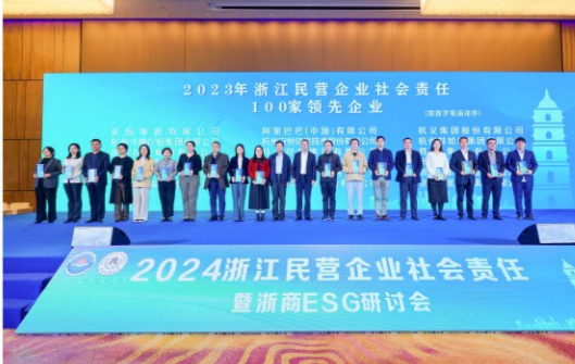
2024浙江民营企业社会责任100家领先企业授牌仪式