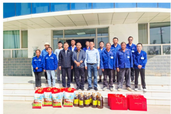
中秋佳节前夕, 新疆恒优公司的随障员工接受当地残联的慰问。