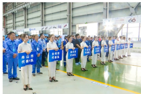
2024年浙江省仪器仪表类职工职业技能竞赛上, 桐昆集团嘉兴石化的两名职工作为嘉兴代表队成员参赛, 分别取得了第5名和第11名的成绩, 展现专业技术水平的同时诠释了精益求精、追求卓越的工匠精神。(通讯员 王丹红)

此次培训结合企业内部各部门工作实际, 对于员工增强自身依法从业意识具有较强的指导作用, 同时也有助于企业更好地化解员工之间矛盾纠纷, 持续提升依法治理水平。