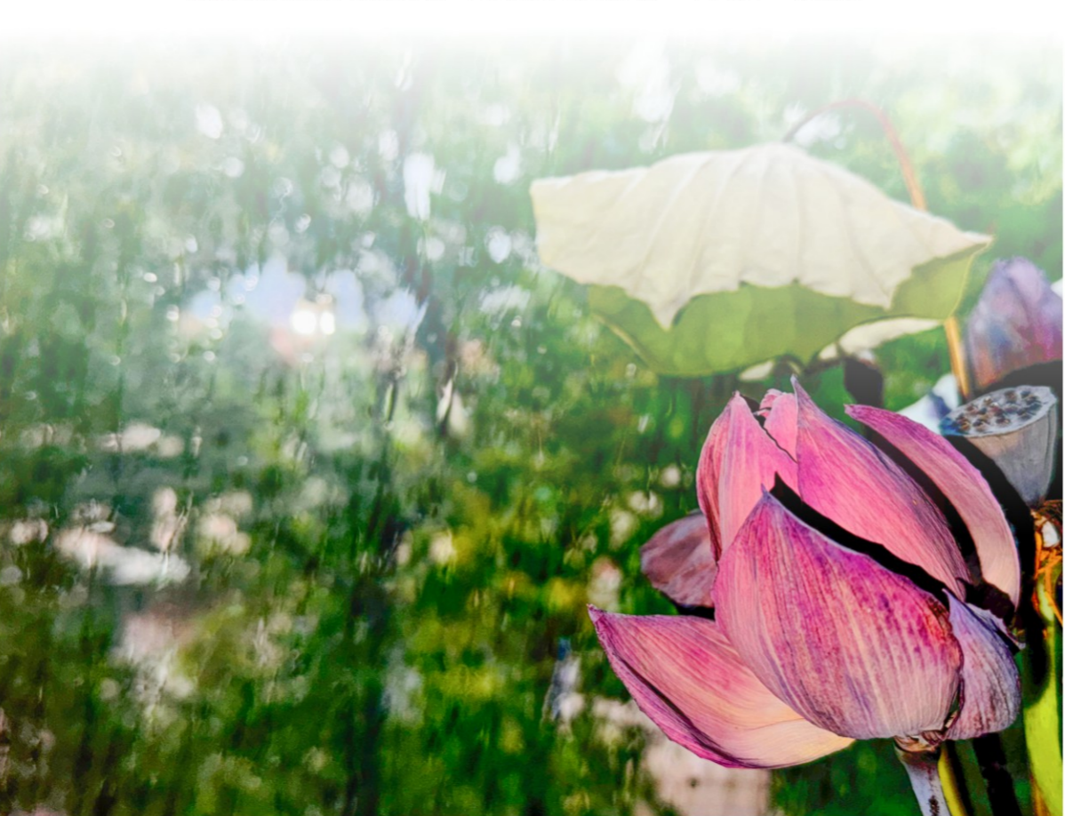
■《雨荷》恒通公司 张婷 摄